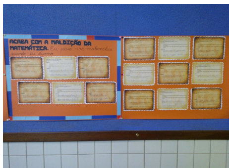
Figura 1: Trabalhos dos alunos (minificha n.º 1) expostos na sala de aula.

O segundo objeto de trabalho foi realizado no final das duas primeiras intervenções, uma vez que os alunos tinham que escolher o ambiente em que poderiam ver matemática, necessitando para isso de todo um pré-trabalho que tornasse a segunda minificha compreensível e, de certa forma, espontânea para os alunos. Em suma, a segunda minificha constituiu-se como uma espécie de base para os alunos do 1.º ano criarem e resolverem o seu próprio problema matemático.