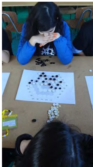
Figura 6: Produto.