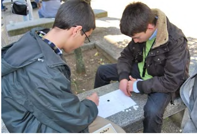
Figura 7: Sesqui.

Clique em https://www.youtube.com/watch?v=wm51PgBysfs