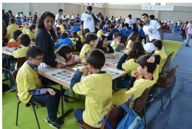
Figura 2: Semáforo.