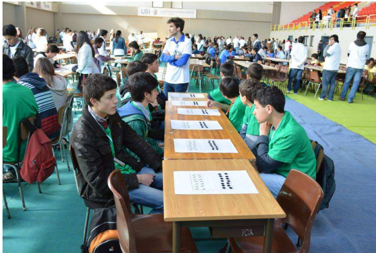
Figura 4: Avanço.

Clique em https://www.youtube.com/watch?v=1koh79bnbUY&feature=youtu.be