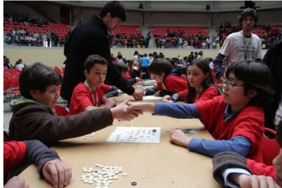
Figura 5: Rastros.