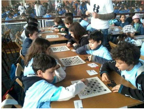
Figura 3: Gatos e Cães.