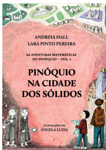
Figura 1: Capa do livro Pinóquio na Cidade dos Sólidos .

Na primeira história, o Pinóquio embarca numa excitante viagem à Cidade dos Sólidos onde fica a conhecer algumas famílias de sólidos geométricos e se vê envolvido numa aventura em busca de um tesouro. Tal como no primeiro volume, cada história é acompanhada com diversos tipos de ilustração (meia página, página inteira, apontamentos laterais) e todos os conceitos são explicados em apontamentos nas margens das folhas. A Figura 2 contém as páginas 10-11 do livro onde se pode ver o Pinóquio à chegada da Cidade dos Sólidos numa ilustração de página inteira bem como alguns apontamentos explicativos laterais sobre poliedros, paralelepípedos e prismas.