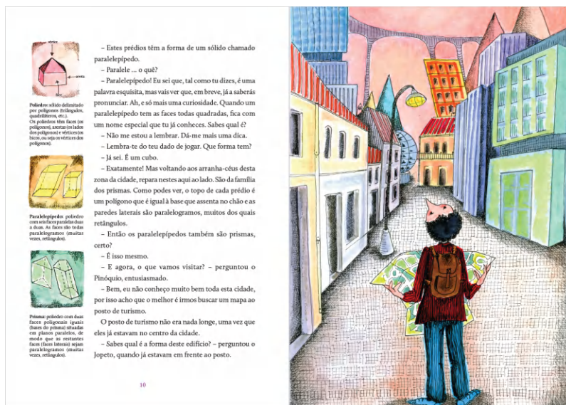
Figura 2: Páginas 10-11 do livro com a chegada à Cidade dos Sólidos e algumas notas explicativas laterais.

Na primeira história, o Pinóquio embarca numa excitante viagem à Cidade dos Sólidos onde fica a conhecer algumas famílias de sólidos geométricos e se vê envolvido numa aventura em busca de um tesouro. Tal como no primeiro volume, cada história é acompanhada com diversos tipos de ilustração (meia página, página inteira, apontamentos laterais) e todos os conceitos são explicados em apontamentos nas margens das folhas. A Figura 2 contém as páginas 10-11 do livro onde se pode ver o Pinóquio à chegada da Cidade dos Sólidos numa ilustração de página inteira bem como alguns apontamentos explicativos laterais sobre poliedros, paralelepípedos e prismas.