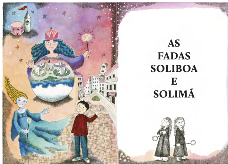
Figura 3: Páginas 36-37 da história As Fadas Soliboa e Solimá .

A segunda história é uma aventura que envolve duas irmãs fadas, a Soliboa e a Solimá. No seu tempo de aprendizes foram incumbidas de criar uma cidade de sólidos. Mas, como confundiram o conceito de sólido geométrico com o estado sólido da matéria, criaram cidades onde tudo estava no estado sólido, ou seja, fazia muito frio e toda a água estava na forma de gelo. Com muito esforço e dedicação conseguiram trazer o calor e a vida a uma das cidades. Agora aconteceu uma catástrofe: a cidade foi invadida por uma onda de frio e tudo congelou à sua volta. A sorte do Pinóquio foi não ser humano e apenas digital. Só assim pode salvar o seu pai Jopeto e toda a cidade. A Figura 3 mostra as páginas iniciais desta história.