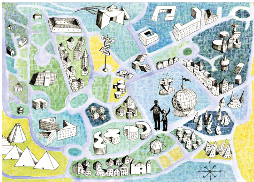
Figura 7: Guardas do livro Pinóquio na Cidade dos Sólidos .

retas e oblíquas, regulares e não regulares, convexas e côncavas, foi um desafio enorme para a ilustradora. O resultado superou as expectativas das autoras. Para terminar apresentamos a ilustração fantástica do mapa da Cidade dos Sólidos usado para as guardas do livro (Figura 7).